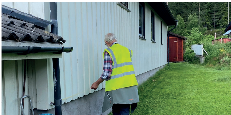
OPPMÅLING: Sommeren og høsten 2024 ble det gjennomført ny eiendomstaksering i Flesberg.