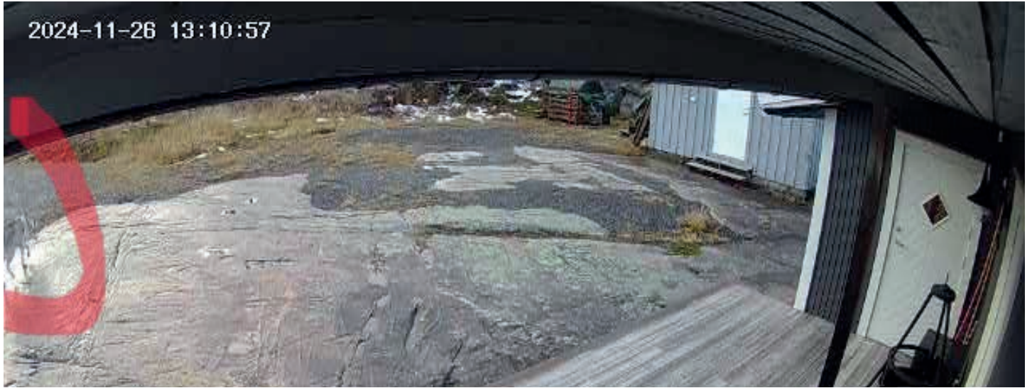
ULV ULV!: Innenfor den røde ringen til venstre i bildet er det et grått dyr med fire bein.