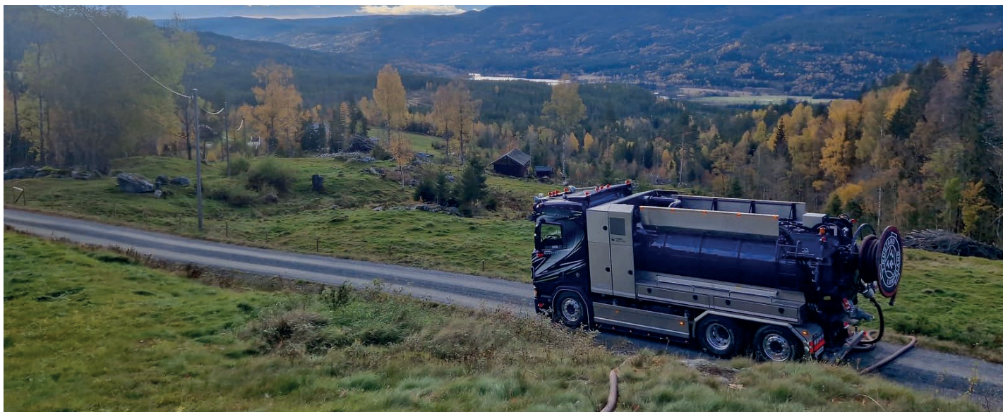
MANGE LASS: Det er plass til 12 kubikkmeter slam på bilen, det vil si ca tre tømninger per tur.