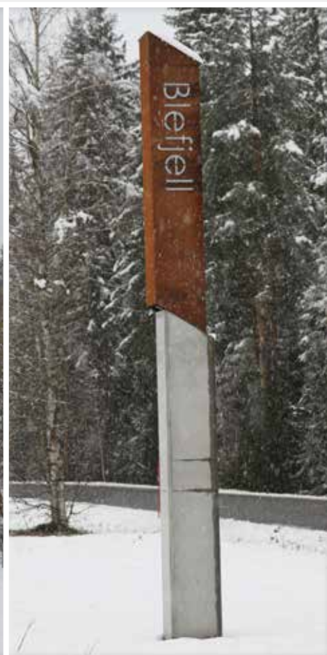
De nye skiltene som er satt opp på Søndre Blevei.

biler. Pris for en bil blir 1215 kroner, mens prisen for to biler blir 1820 kroner.