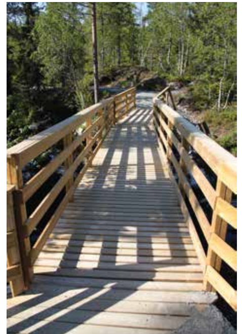
Den nye brua som er bygget over Våtvassselva.