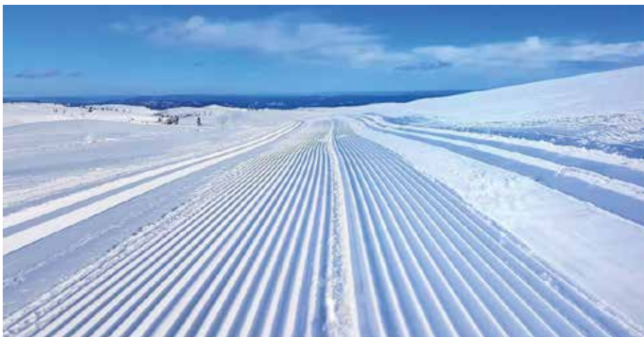
TRIKKESKINNER: Det koster å lage fine skispor både for klassisk og skøyting.

Løypeforeningen sliter likevel med å få alle hytteeierne på Blefjell til å betale 600 kronene til løypeforeningen.