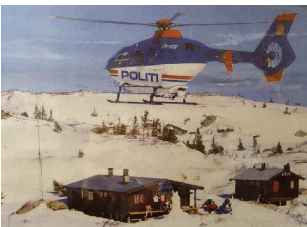
INN FOR LANDING: Kongsberg Røde Kors samarbeider også med politiet. Her går politiets helikopter inn for landing på Flisebu for en del år tilbake.