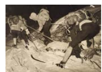
TRESKI OG PULK: I starten var det muskelkraft som skulle til når folk måtte redde ut av fjellet.