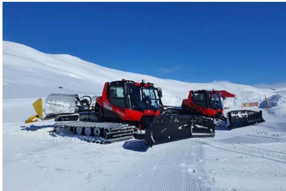
BEDRE UTSTYR: Løypeforeningen sikter litt høyere, dette er drømmen som kan bli virkelighet kanskje allerede neste høst.

Det er flere grunner til denne oppgraderingen. En grunn er at skiløperne ønsker stadig høyere standard, det vil si både skøytespor og vanlige spor. Løypeforeningen har lenge jobbet med å utvide traseene og de fleste steder er det allerede sju meter bredde. Men, når traseen er brei og løypemaskinen er smal, må man kjøre flere ganger for å legge spor. – Med en stor maskin kan vi kjøre mindre, påpeker Tore Bjerknes.