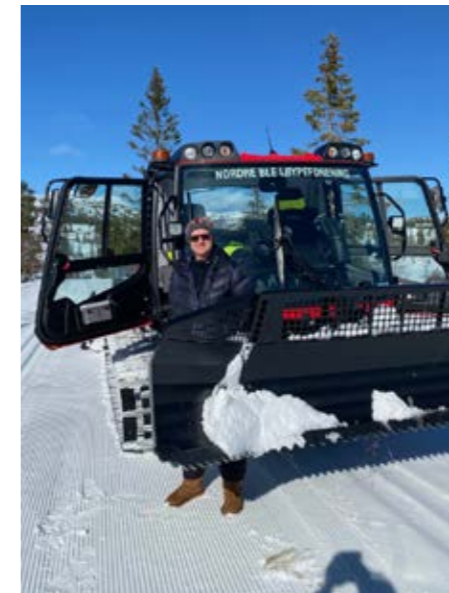
KJØRER EGEN MASKIN: Nordre Blefjell Løypeforening har eget utstyr og kjørte forrige sesong 2535 kilometer.

Blefjell Løypeforening er klart størst med åtte løypemaskiner til rådighet og 10905 kjørte kilometer i et løypenett på 180 km forrige sesong. Nordre Blefjell Løypeforening har en maskin som kjørte 2535 kilometer i 2022/23. Løypenettet er ca 60 kilometer. Delelinjen mellom nord