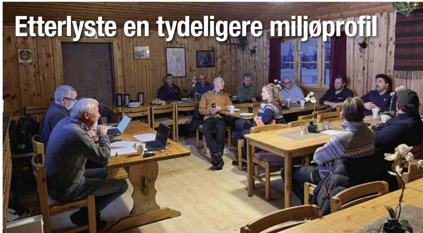
BRA FRAMMØTE: Det var bra frammøte på årsmøtet på Blestua, påpekte styret.